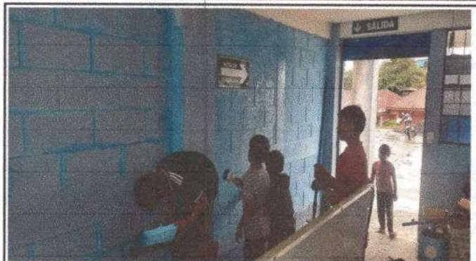
Foto 8: Pintura en muros interiores y exteriores, un total de 500 M2