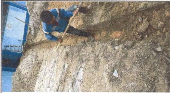
Foto7: Reparación de cuneta de concreto, un total de 10 ML