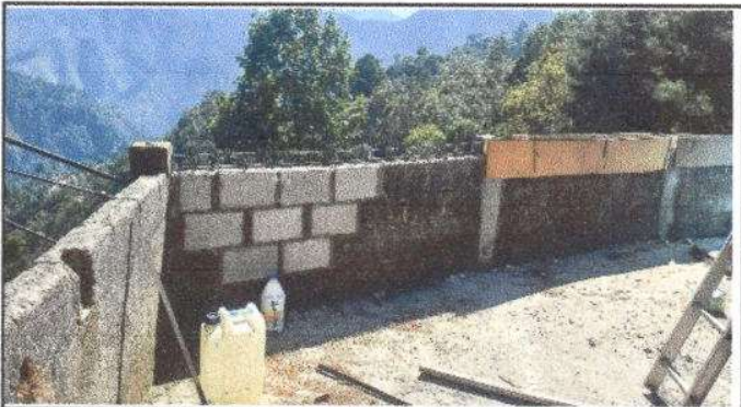
Foto 9: Reparación de muro perimetral de block, un total de 47.5 M2