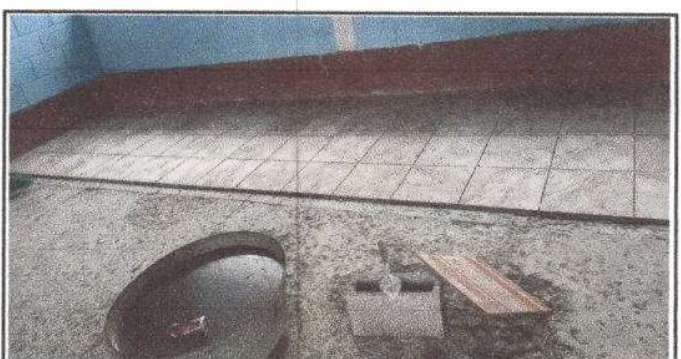
Foto 6: Sustitución de piso de cemento por piso cerámico, un total de 95 M2.

Observación: Si es necesario se pueden agregar hojas adicionales, especificar el número de hojas.