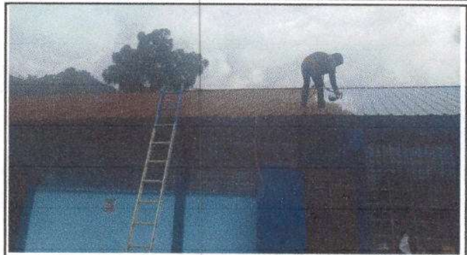
Foto 2: Mantenimiento a estructura de soporte de metal, un total de 347.50 m2.