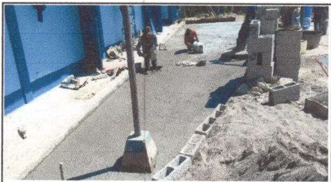
Foto 10: Sustitución de piso de tierra por torta de cemento, un total de 60 M2.